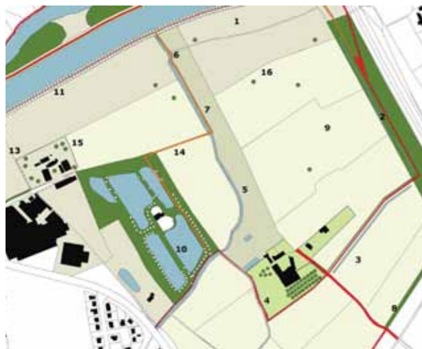
BEELD UIT SCHETS GULDENBERG-BIEZENVELD

Sinds geruime tijd zijn er contacten met Frankrijk over de ontwikkeling van de Leievallei als groene as doorheen de metropool. De Provincie West-Vlaanderen heeft samen met CUDL en Leiedal een Europees project ingediend om deze samenwerking te verstevigen en om te zetten in concrete en zichtbare realisaties. Op 18 maart werd het project goedgekeurd onder de naam "Corrid'or".