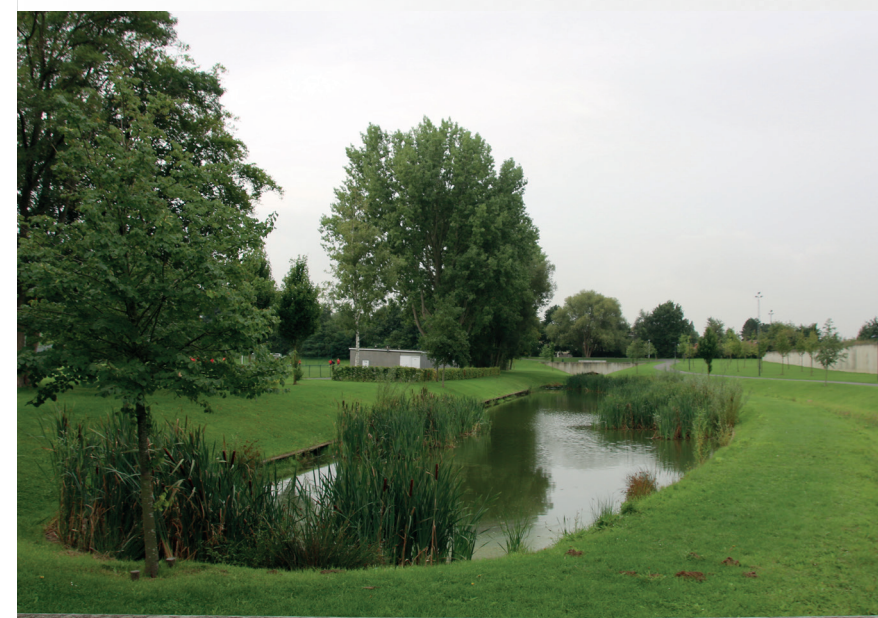
Referentiebeeld De Blokken, Zwevegem

Een collectieve waterplas voor infiltratie en buffering spaart ruimte op de individuele percelen. Ze biedt de brandweer bluswater en geeft een multifunctionele meerwaarde aan het publieke domein.