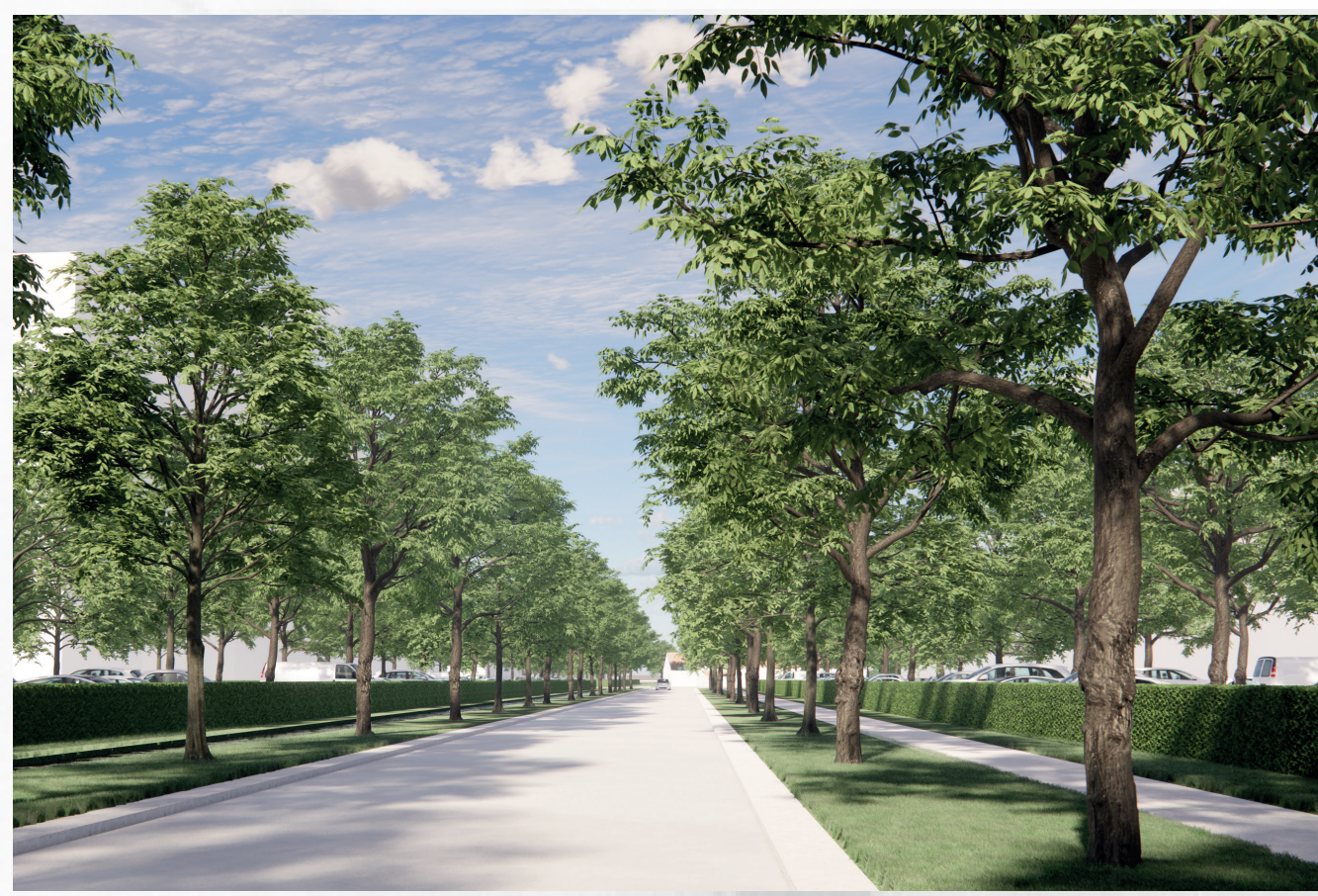
Een eerste 3D-beeld van de dreefstructuur als toegangsweg

De toegangsweg met bomen krijgt extra parkeerplaatsen. Die worden publiek, zodat ook bezoekers en buurtbewoners er gebruik van kunnen maken. Dat verkleint ook de parkeerdruk in omliggende straten.