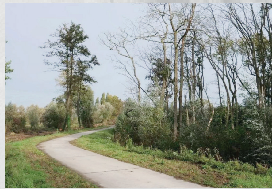
Referentiebeeld bedrijventerrein Groenbek, Waregem

Het terrein wordt zo goed mogelijk ingebed in zijn omgeving. Langs de Kastanjeboomstraat komen brede groenbuffers met talud om voldoende afscherming te voorzien naar het open landschap en de woningen. We planten streekeigen groen aan dat voldoende visuele afscherming biedt, ook tijdens de wintermaanden.