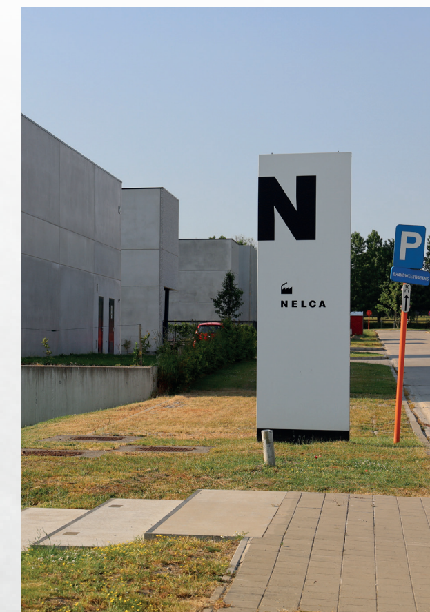
Referentiebeeld bedrijventerrein Nelca, Lendeled