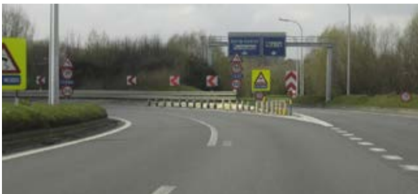
Onderzoek over het al dan niet sluiten van de R8 tussen Kortrijk-Zuid en Kortrijk-Oost