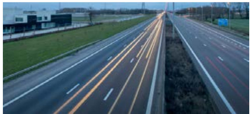
Onderzoek complexen Kortrijk-Oost en de paperclip in Stasegem